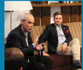
OGH Präsident Eckart Ratz